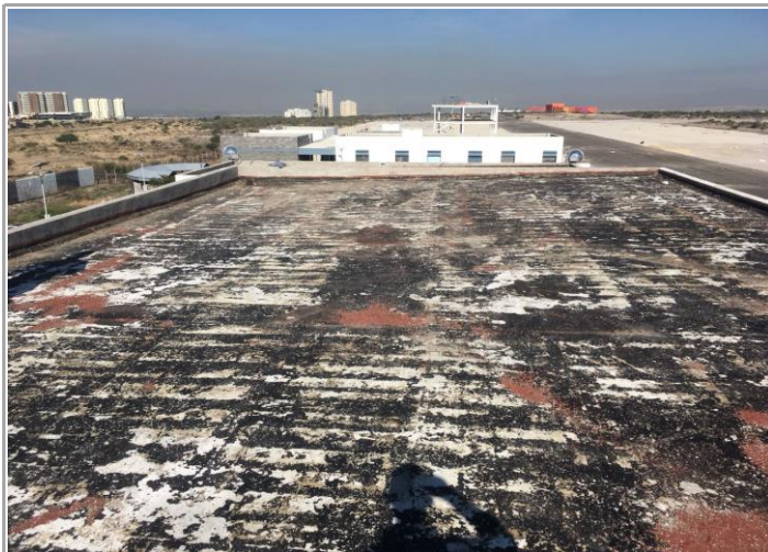
F1: Fachada principal